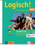
Logisch! neu B1