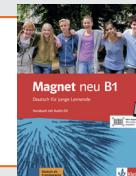
Magnet neu B1