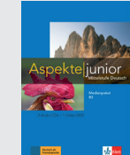
Aspekte junior B2