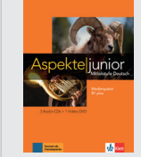
Aspekte junior B1+