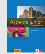
Aspekte junior B2