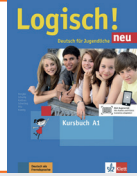
Logisch! neu A1