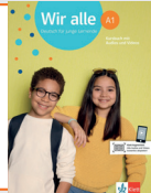
Wir alle A1