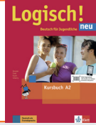
Logisch! neu A2