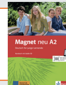
Magnet neu A2