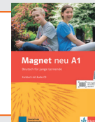
Magnet neu A1