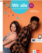
Wir alle B1