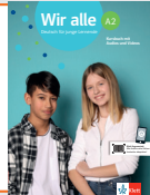
Wir alle A2