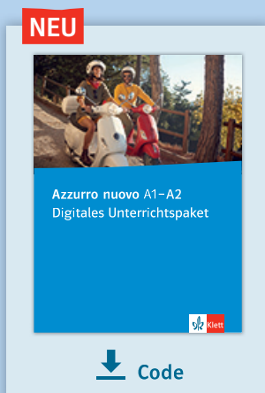
Azzurro nuovo A1 – A2 Digitales Unterrichtspaket für Unterrichtende NP00852569001 Erhältlich ab September 2023