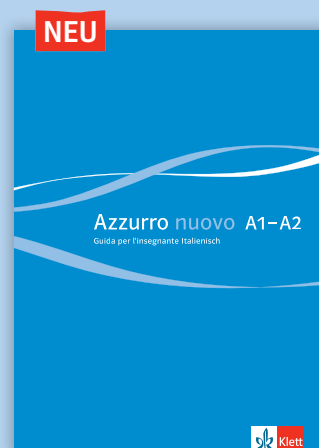
Azzurro nuovo A1 – A2 Guida per l'insegnante 978-3-12-525690-3 Erhältlich ab Juni 2023