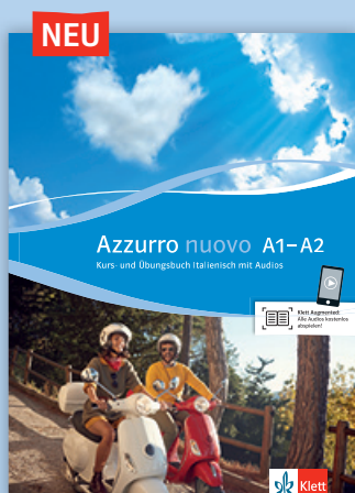
Azzurro nuovo A1 – A2 Kurs- und Übungsbuch mit Audios 978-3-12-525689-7 Erhältlich ab Juni 2023