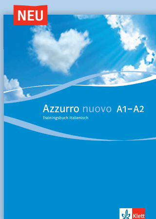
Azzurro nuovo A1 – A2 Trainingsbuch 978-3-12-525691-0 Erhältlich ab Dezember 2023