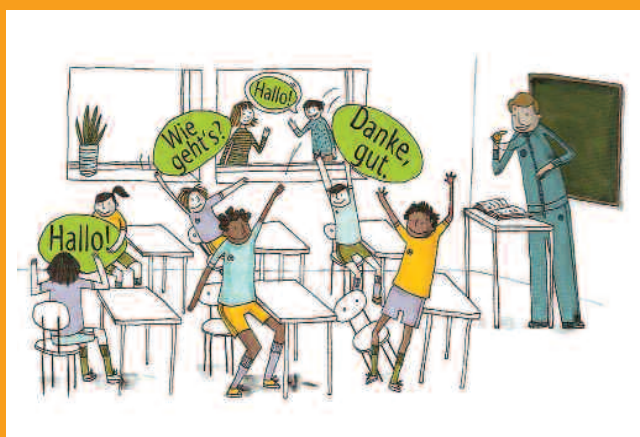
Abbildung aus dll 15