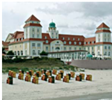
die Strandpromenade in Binz