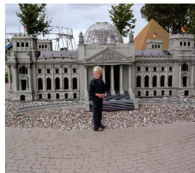
der Freizeitpark in Gingst

1 Spielt mit verteilten Rollen. Macht dann neue Dialoge.