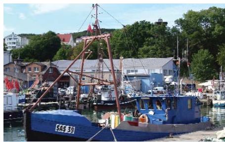
der Hafen in Sassnitz