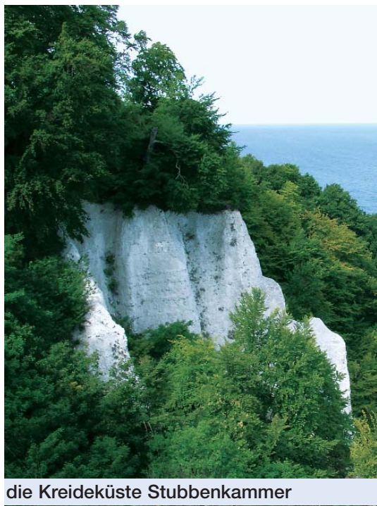
die Kreideküste Stubbenkammer