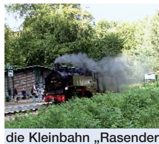
die Kleinbahn „Rasender Roland“ in Gohren