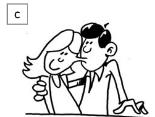
situation n° .....