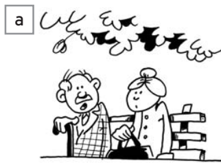
situation n° .....

► Associez chaque situation à la bonne image (1,5 point par réponse). Attention : il y a cinq images, mais seulement quatre situations.