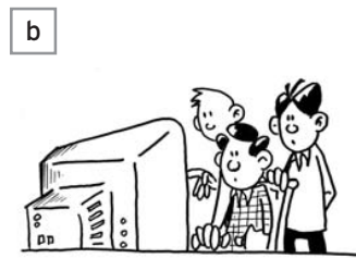
situation n° .....