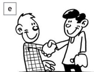
situation n° .....