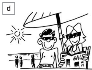
situation n° .....