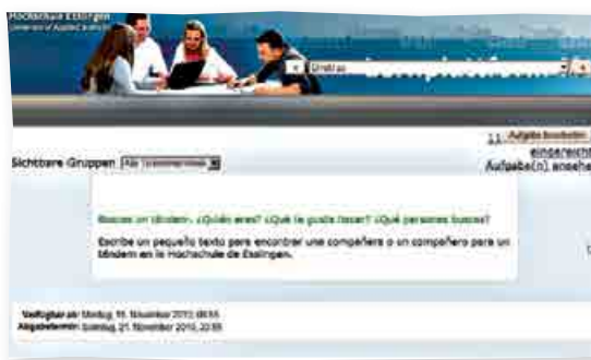
Figura 3: curso Moodle de Con dinámica , Universidad de Esslingen

Todo lo nuevo crea en un principio inseguridad y reserva y así reaccionamos estudiantes y profesorado. Con el tiempo he observado como profesora que este trabajo en la plataforma se agradece por diversos motivos: