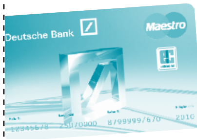
tarjeta de crédito