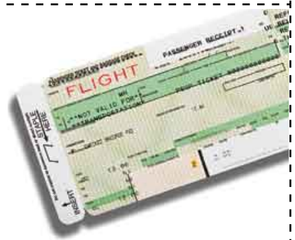
billete de avión